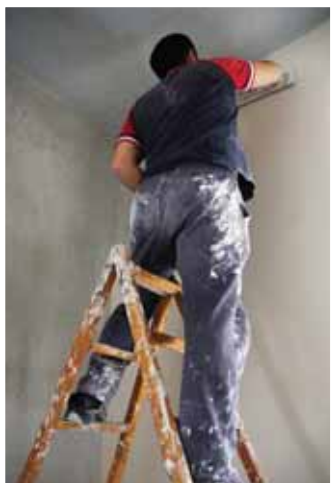
用填缝料处理隔墙（上图）和与吊顶连接处（左图）的板缝。