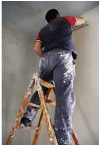
用填缝料处理隔墙（上图）和与吊顶连接处（左图）的板缝。